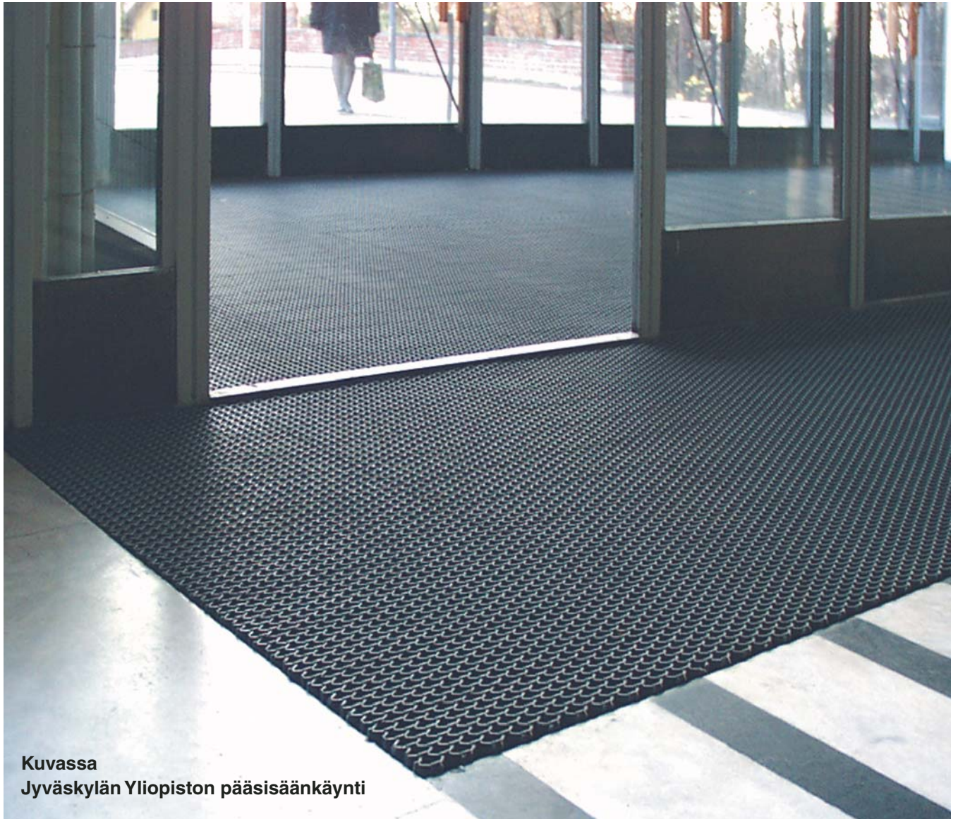
Kuvassa Jyväskylän Yliopiston pääsisäänkäynti